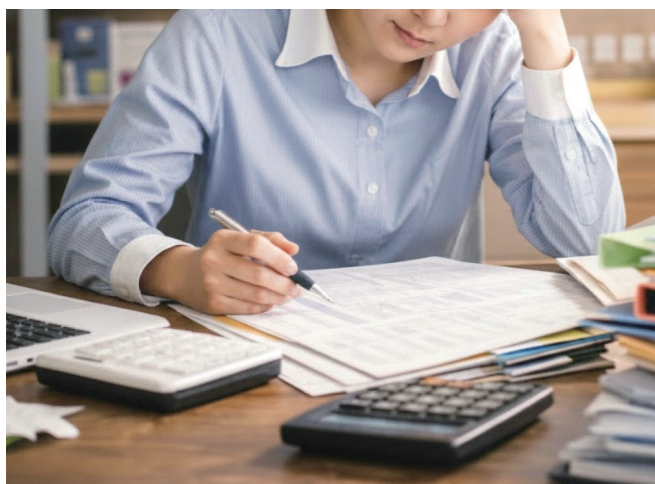
複雑化する給与計算

2026年から、給与計算における扶養親族の算定ルールが変更され、所得100万円以下の特定親族も対象となります。そのため、令和8年分の扶養控除等申告書(マル扶)の内容を確認し、最新の源泉徴収税額表で源泉税を計算することが重要です。また、取引適正化法の施行により、振込手数料は原則買手負担となりました。売手負担としていた場合、経理処理や消費税の取扱いを見直す必要があります。