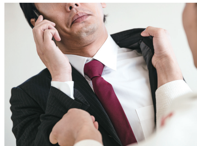
守るべき公益通報

公益通報者保護法は労働法ではありませんが、労務管理においても重要な制度です。今回の改正により、業務委託中のフリーランスや契約終了後1年以内のフリーランスも保護対象となりました。また、公益通報を理由とする解雇や懲戒には、刑事罰や法人罰が科されます。さらに、通報後1年以内の解雇や懲戒は、公益通報を理由としたものと推定されます。人事労務ご担当者様は、制度理解が大切です。