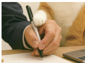
猫の手も借りたい繁忙期

みらい創研入社20年以上の大ベテランに、なんでもご相談ください。実は！？登録者数1万人超えユーチューバー社員。