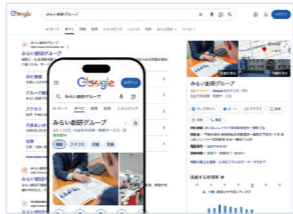
重要なGoogleビジネスプロフィール

みらい創研グループ全体のホームページやインターネット広告など、AI・ITの責任者です。知識も名前も、ホンモノ！？