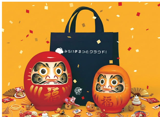
限定福袋イメージ

2026年最初の運試しとして、日頃のご愛顧に感謝の気持ちを込めて特別な福袋をご用意しました。 公式LINEの友だち登録 、または 専用応募フォームから簡単にご応募 いただけます。福袋には、新年にうれしい縁起物や、日常で役立つ便利グッズをたくさん詰め合わせています。応募締切まで残りわずかとなっていますので、この機会にぜひご参加ください。(募集期間：11月25日～1月25日)