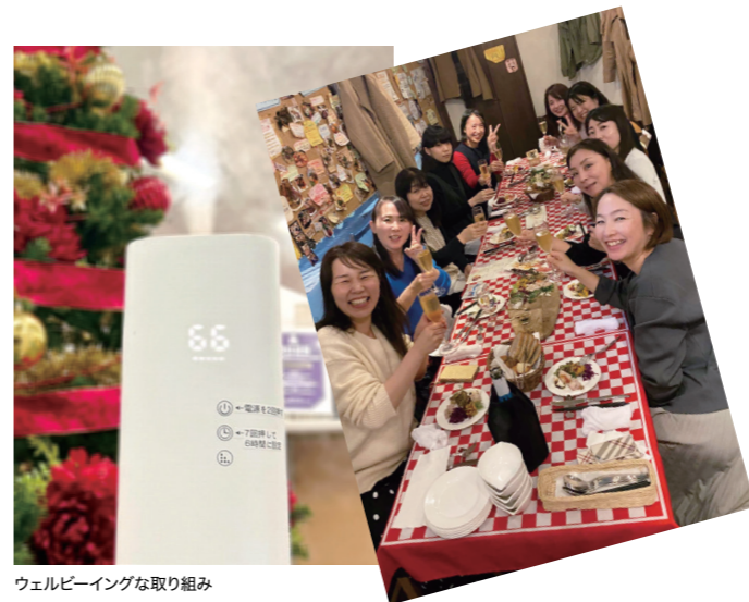
ウェルビーイングな取り組み

冬は寒さと乾燥が深まり、体調を崩しやすい季節です。宮城県内では、インフルエンザの罹患率が高い水準で推移しており、例年以上に注意が必要です。乾燥はウイルスが広がりやすくなる原因と言われており、弊社では加湿器を設置して職場の空気環境を整えています。12月にはエントランスのクリスマスツリーが職場に彩りを添え、心を和ませてくれたり、ひとりひとりが安心して働ける環境づくりは、「今よりもっといい未来を」を目指す私たちにとって大切な取り組みです。