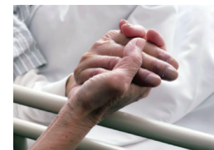
早めに考えたい相続対策

【お問い合わせ】みらいえ相続行政書士法人 | TEL | 0120-957-339