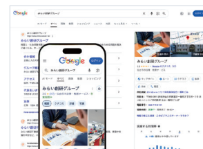
重要なGoogleビジネスプロフィール

みらい創研グループ全体のホームページやインターネット広告など、AI・ITの責任者です。知識も名前も、ホンモノ！