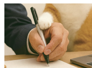
猫の手も借りたい繁忙期

みらい創研入社20年以上の大ベテランに、なんでもご相談ください。実は！登録者数1万人超えユーチューバー社員。