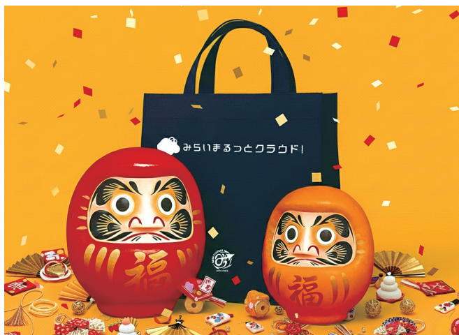
限定福袋イメージ

2026年最初の運試しとして、日頃のご愛顧に感謝の気持ちを込めて特別な福袋をご用意しました。 公式LINEの友だち登録 、または 専用応募フォームから簡単にご応募 いただけます。福袋には、新年にうれしい縁起物や、日常で役立つ便利グッズをたくさん詰め合わせています。応募締切まで残りわずかとなっていますので、この機会にぜひご参加ください。(募集期間: 11月25日~1月25日)