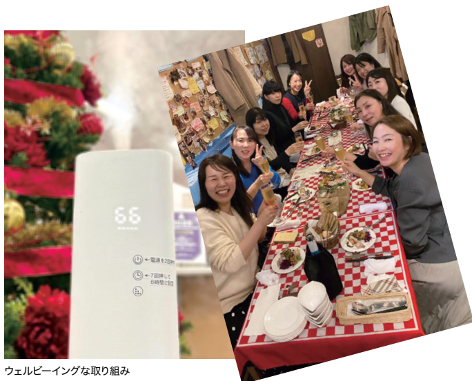
ウェルビーイングな取り組み

冬の寒い季節も、安心して健やかに働ける、 みらい創研グループのウェルビーイングな職場環境づくりとは？