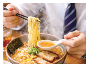
心も体も温まる冬のランチ

みらい創研入社20年以上の大ベテランに、なんでもご相談ください。実は!?登録者数1万人超えユーチューバー社員。