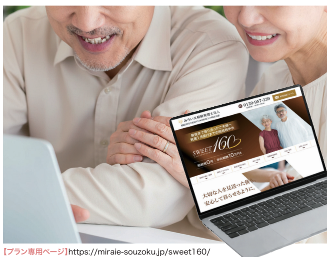
【プラン専用ページ】 https://miraie-souzoku.jp/sweet160/

このプランは、配偶者の税額軽減制度を活用し、資産1.6億円まで相続税を0円とする新しい相続税申告サービスです。申告報酬は定額制で、相続専門の税理士が、必要書類の確認から申告手続きまで丁寧にサポートいたします。お手元の資料だけで対応できて、難しい手続きや長時間の面談は不要なため、初めての相続でも安心してご利用いただけます。詳しくは、プラン専用ページをご覧ください。