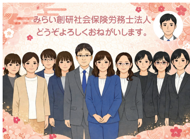
個性的で気軽に相談できる社労士法人スタッフ